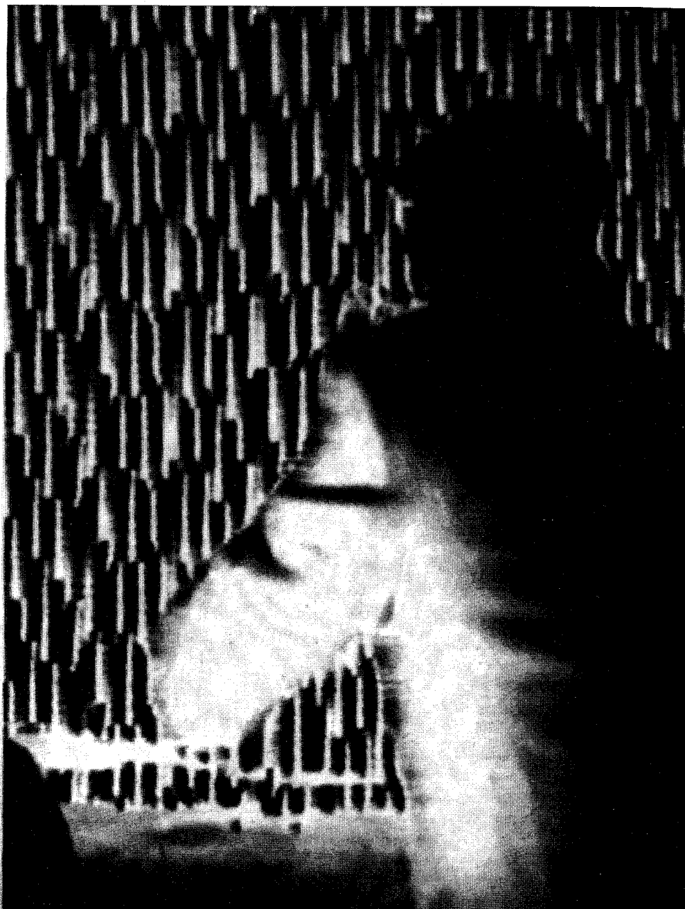
Woody Vasulka, Art of Memory - 1987